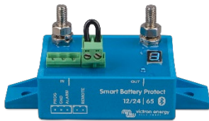
Smart BatteryProtect BP-65