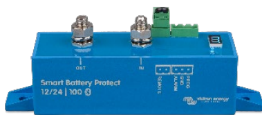
Smart BatteryProtect BP-100